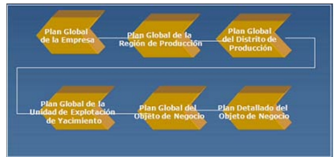
Fig. 1. Esquema General del Proceso de Planificación en Petróleo

comenzando con el plan global de la empresa hasta llegar al plan del lazo de producción (en el caso de la industria petrolera, dicho lazo de producción está conformado por una Estación de Flujo (EF) con sus respectivas instalaciones asociadas (pozos, Múltiples de Levantamiento Artificial por Gas (MLAG), plantas compresoras, patio de tanques, entre otros), tal y como se muestra en la Figura 2. De esta manera, lo que se propone es realizar una modificación a la última fase de construcción del plan global del negocio, tal que ahora se realiza el plan de negocio para el grupo de elementos del lazo de producción como un todo, y no individualmente para cada objeto de negocio (además, este plan lo realizarían los agentes del nivel superior).