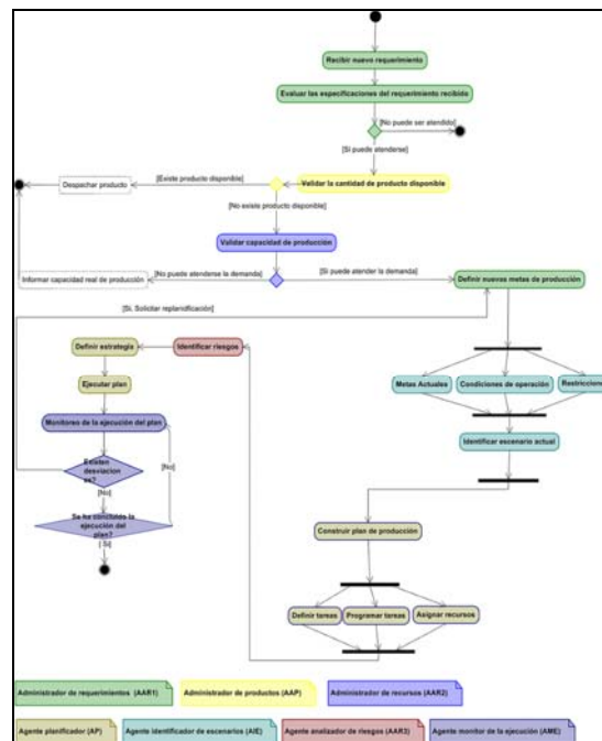
Fig. 4. Diagrama de Actividad - Flujo Básico Proceso de Planificación

A continuación se muestra un diagrama de actividad que ilustra el flujo básico general a realizar por el SMA durante la construcción, ejecución y monitoreo del plan de producción. El color asignado en el diagrama a cada actividad permite identificar el agente responsable de su realización (Figura 4).